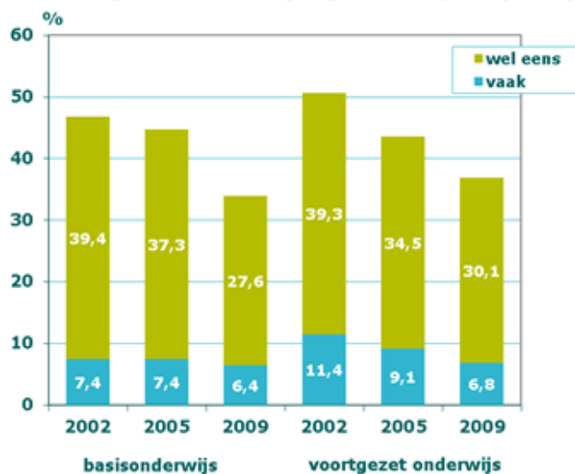
Percentage kinderen en jongeren dat pest (2009)

licht gedaald. Ruim 6 procent van de leerlingen zegt vaak te pesten, dit percentage is in het voortgezet onderwijs iets hoger dan binnen het basisonderwijs (HBSC 2009). Jongens pesten op alle leeftijden vaker dan meisjes. Vmbo-leerlingen pesten vaker dan vwo-leerlingen. In de afgelopen jaren zijn er verschillende onderzoeken uitgevoerd naar het pestgedrag van kinderen en jongeren. Er zijn drie grote monitoren die elke paar jaar herhaald worden: het HBSC-onderzoek, de Nationale Scholierenmonitor en de Monitor Jongeren en Internet. Daarnaast is er in 2003 nog de Peiling Jeugd en Gezondheid uitgevoerd, een groot onderzoek naar de leefsituatie en welzijn (waaronder pestgedrag) van kinderen. Al deze onderzoeken gaan uit